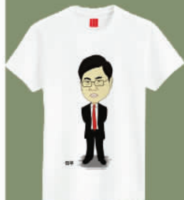
校领导漫画文化衫